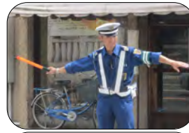
8月9・10日 松戸宿坂川 献灯まつり

常駐保安部では七月に上野、八月に松戸祭りの臨時警備支援を実施しました。両日とも事故もなく終了するこゝとが出来ました。尚、上野の臨警では管理本部からも二名を応援に出しました。参加された隊員の皆さんお疲れ様でした。