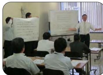
各班の発表の様子

七月十三日・十九日に管理監督者研修を実施しました。テーマは「既存顧客の確保と新規顧客の開拓」で、各班で現状の問題点と対策を考え、発表を行いました。八月は発表したことについて取り組み、九月にその成果を発表する予定です。