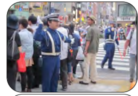
7月21・22日 うえの夏まつり パレード