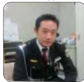
売上に貢献した 白旗地区隊長

常駐保安部文京シビックセンター警備隊白旗地区隊長は、文京シビックセンター駐輪場の監視カメラが故障している事実を把握するや、管理監督者教育の中でセオス営業を思い出し、機械警備部に対し速やかな情報提供を行い、年額一七〇万円に上る契約を受注することが出来ました。このことは、管理監督者教育の実践的成果を示すと共に、その業務に対する姿勢は他従業員員の模範と認められ一月十六日の新年会にて表彰されます。