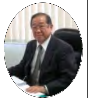
取締役管理本部長