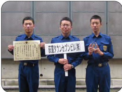
荻窪タウンセブンビル自衛消防隊の皆さん

全日本ガードシステムは、荻窪消防署主催の大会が九月二十五日に井草森公園にて開催されました。