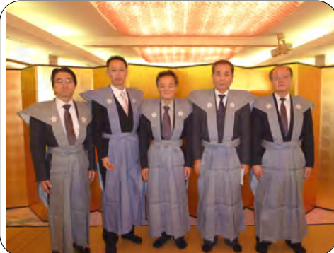
参加された皆さん

2月3日の節分の日、毎年湯島天満宮で節分祭が開催され、境内で豆まきが行われます。当社からも毎年年男、年女の方に豆まきに参加していただいています。 当日は天気も良く、たくさんの方参加に向けて豆をまいて邪気を払い、今年一年の無病息災を願いました。