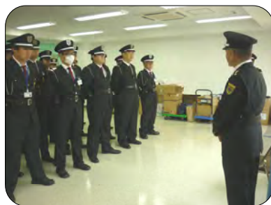
現在の朝礼の様子