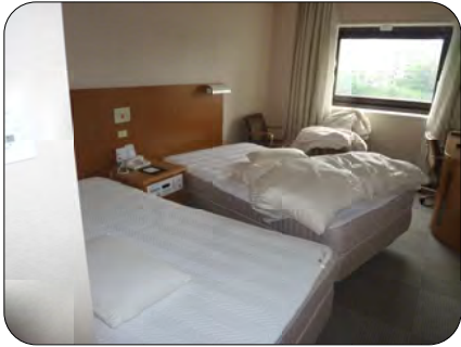
お客様がチェックアウトしたら、ベッドのシーツなどを外します