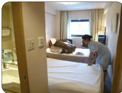
ベッドメイク、清掃をします