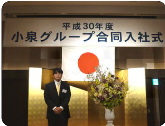
小泉グループ合同入社式