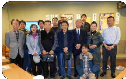
埼玉支社『日高屋カラオケ』