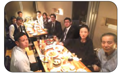
管理本部『チーズフォンデュ!!』

この表彰を機に、ジーエムシー、全日本ガードシステム、両社共に、自衛消防の重要性を認識し今後も活動して参ります。