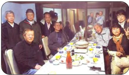
富士営業所『食事会』