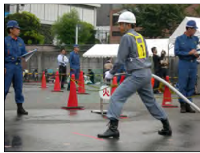
毎年開催される自衛消防操法大会への参加