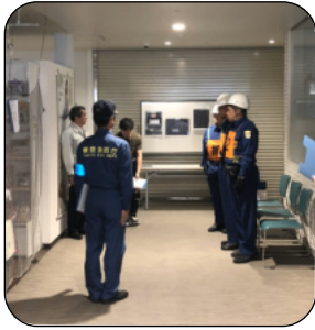
実際に屋内で審査を行った荻窪タウンセブン自衛消防隊の様子