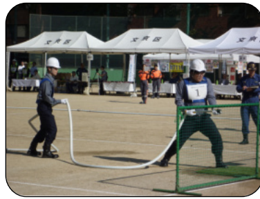
ジーエムシー 自衛消防隊の様子

全日本ガードシステムの荻窪タウンセブン警備隊は、荻窪消防署主催の審査会に出場いたしました。今年は昨年と違い、実際に勤務している開店前の荻窪タウンセブンで審査会が行われました。例年と違う会場で開催されることによって、いつもと違う緊張感と雰囲気味わう事が出来ました。尚、11月13日に杉並公会堂にて表彰が行なわれる予定となっております。