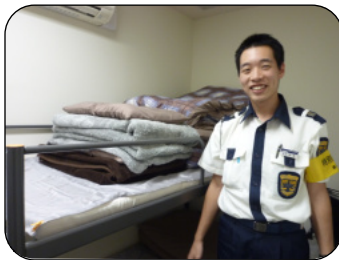
見米警備士と 仮眠室の様子